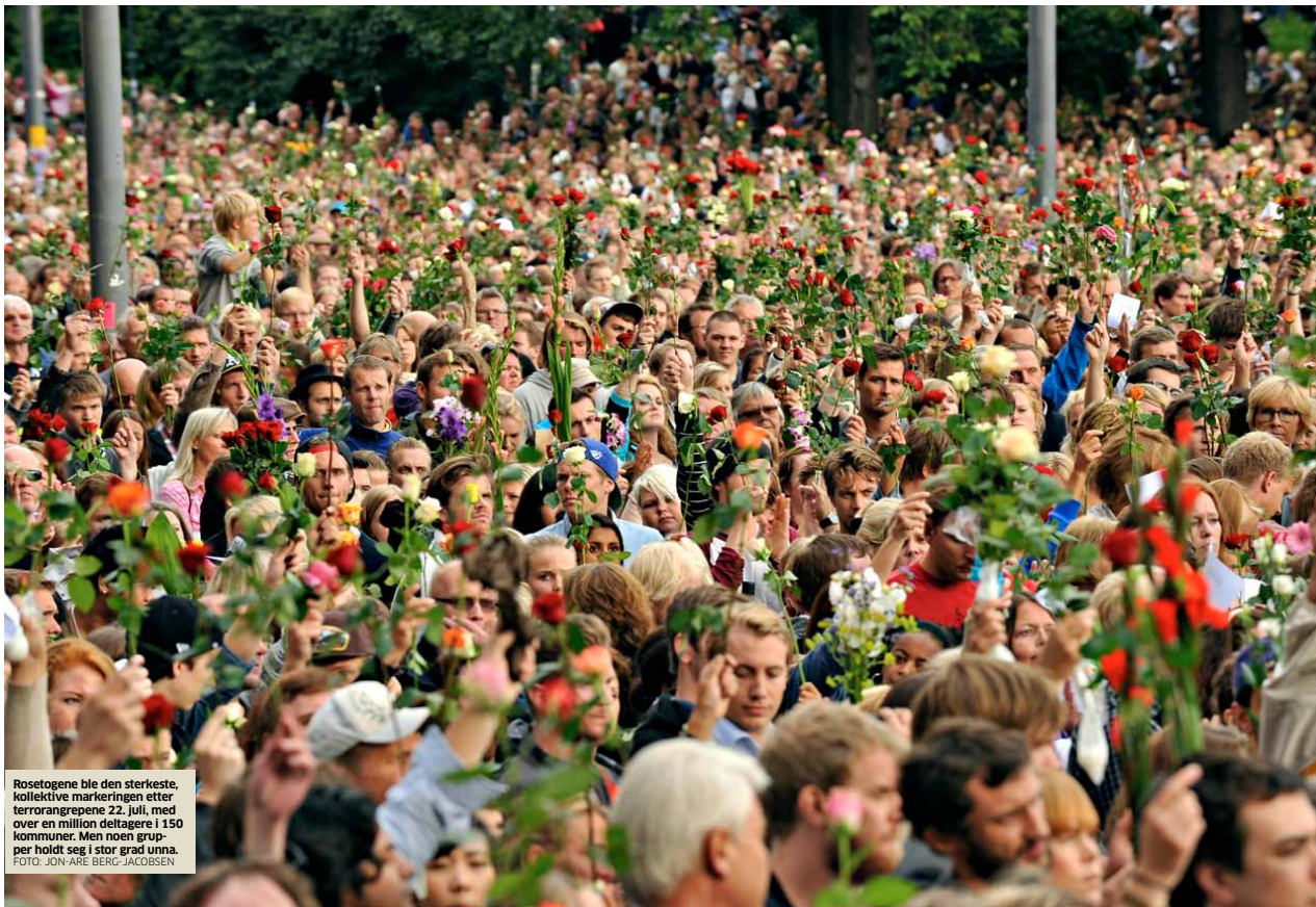
Rosotogene ble den sterkeste, kollektive markeringen etter terrorangrepene 22. juli, med over en million deltagere i 150 kommuner. Men noen grupper holdt seg i stor grad unna.