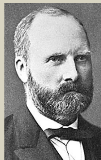
Salmedikeren Elias Blix (1836-1902)