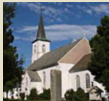
Hvem blir ny sokneprest i Ibestad i Troms?