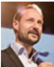
Kronprins Haakon blir høy beskytter for årets TV-aksjon søndag 19. oktober.

■ Kronprins Haakon har sagt ja til å være høy beskytter når Kirkens Nødhjelp (KN) skal samle inn penger i årets TV-aksjon. Pengene fra TV-aksjonen skal gå til KNs arbeid for å sikre tilgang på rent vann og trygge sanitære forhold i flere land i Asia og Afrika. – Gjennom kronprinsens engasjement for FN er han allerede godt kjent med det sjuende millenniumsmålet, der en av indikatorene er tilgang til vann. Det passer perfekt at han er