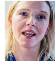
Landbruks- og matminister Sylvi Listhaug (Frp) møtte matvarekjedene i går – deriblant Rema 1000.

– Jeg mener at kirken må våge å bruke kraften som ligger i en ritualisering. For nyåndeligheten har allerede et frodig tilbud på dette området.