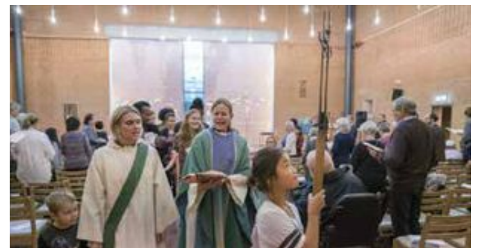
GUDSTJENESTE: 31 prosent av menn og 41 prosent av kvinner i Norge besøkte et tros- eller livssynsmøte i 2016. Bildet er fra Holmlia kirke i oktober.