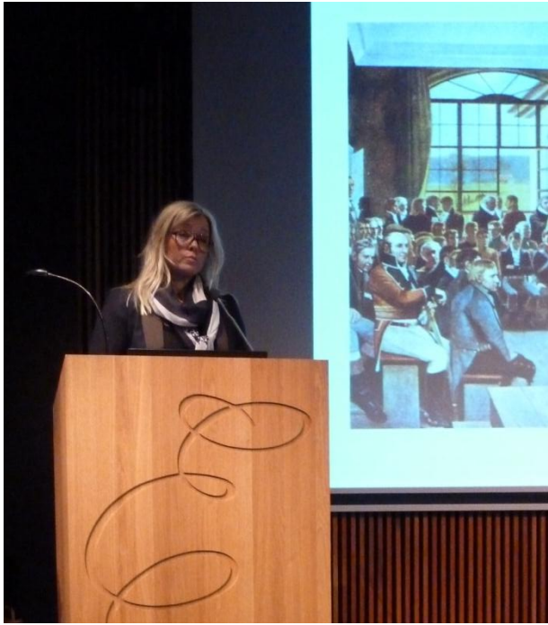
Konferansen ble åpnet av Kjersti Stenseng, statssekretær i Kulturdepartementet