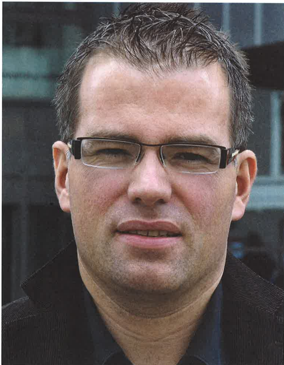
«Anders Breivik and the Rise of islamophobia» er ikke bare et «intellektuelt prosjekt», men viser også at han selv er emosjonelt preget av det som skjedde 22. juli. Dette tillegger boken en fin dimensjon av medmenneskelighet, skriver Samoras anmelder.