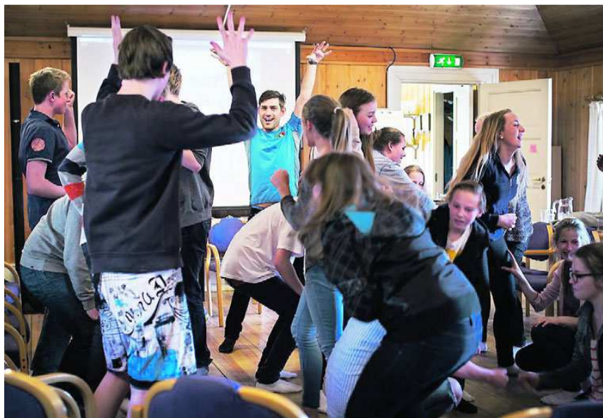
LEK: Konfirmasjonsundervisningen starter med lek for å få opp energinivået i gruppen.

– På skolen får man utenfraperspektivet på tro. I konfirmasjonstiden gir vi ungdommene et arena der det går an å si at man tror på Gud, undre seg, stille vanskelige spørsmål og møte andre mennesker som tror. Det er kanskje ikke så mange steder ungdom i dag får mulighet til dette.