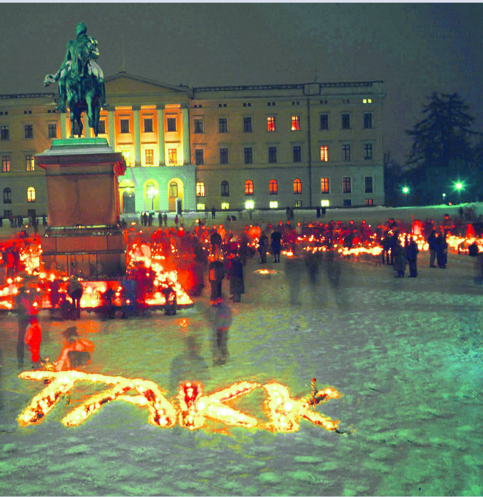
og spontant tente folk tusenvise av levende lys på Slottsplassen. Nå er lystening også blitt del av kirkens ritualer.