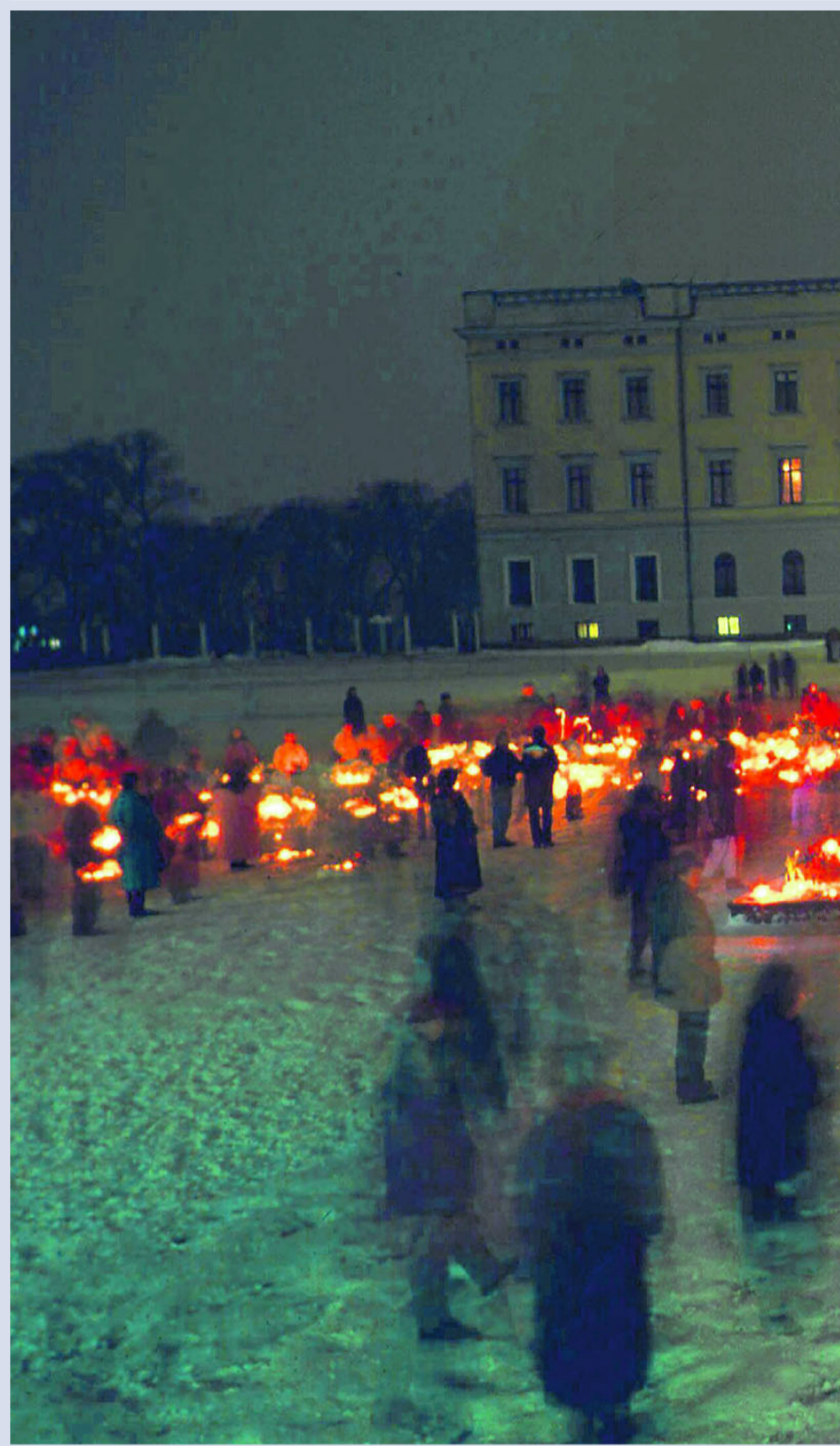
LYSMESSE FOR EN DØD KONGE: 17. januar 1991 døde folkekongen Olav V,