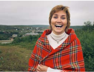
Sametingspresident Aili Keskitalo fikk tale for politikerne under Arctic Frontiers i går.