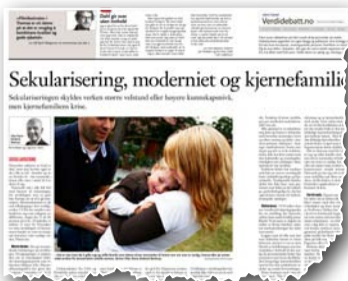
Sekulariseringen skyldes krisen i kjernefamilien, ble det hevdet i et debattinnlegg. Vårt Land 20.01.2014