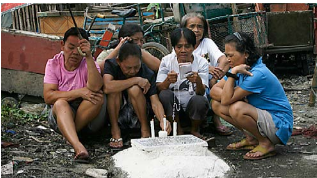
En familie ber og tenner lys ved en grav i byen Navota nord for Manila på Filippinene.