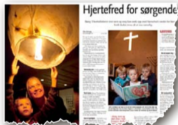
Sorg kan bli til hjertefred i stedet for hjertesorg, tror kunstner.

– Du ser det ved trafikkulykker og annen voldsom død hvor barn og unge forulykker. Få timer etterpå har det vokst opp et alter med lys og blom-