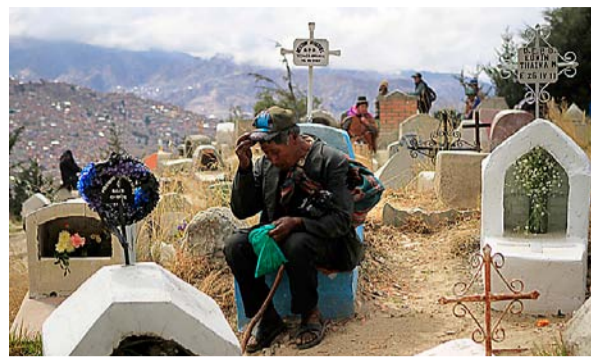
En mann tar en pust i bakken ved en gravsten i utkanten av Bolivias hovedstad La Paz.