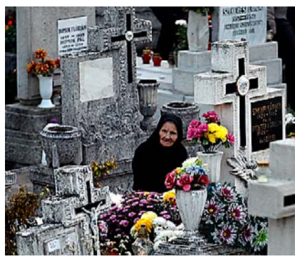
En eldre kvinne minnes sine kjære på en gravlund i Mogyoród øst for Budapest i Ungarn.