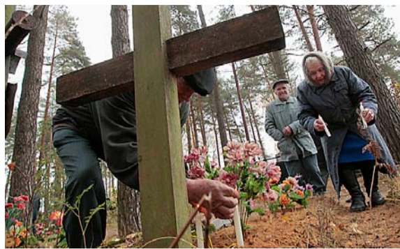
Innbyggere i landsbyen Ivenets, 5 mil sørvest for Minsk i Hviterussland, tenner lys på gravene.